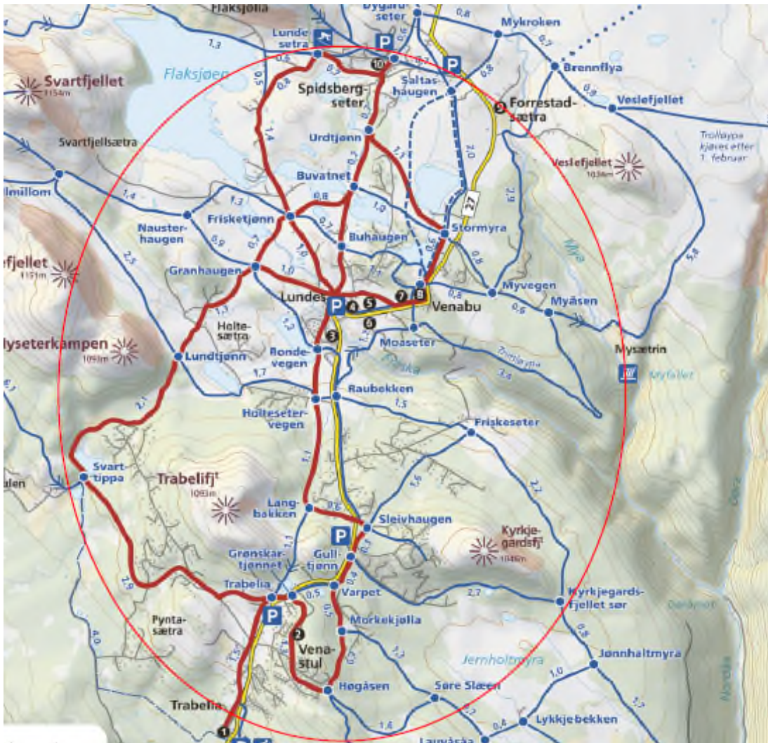
Figur 1: Kart ved varsel om oppstart av planarbeidet som viser planens yttergrense.