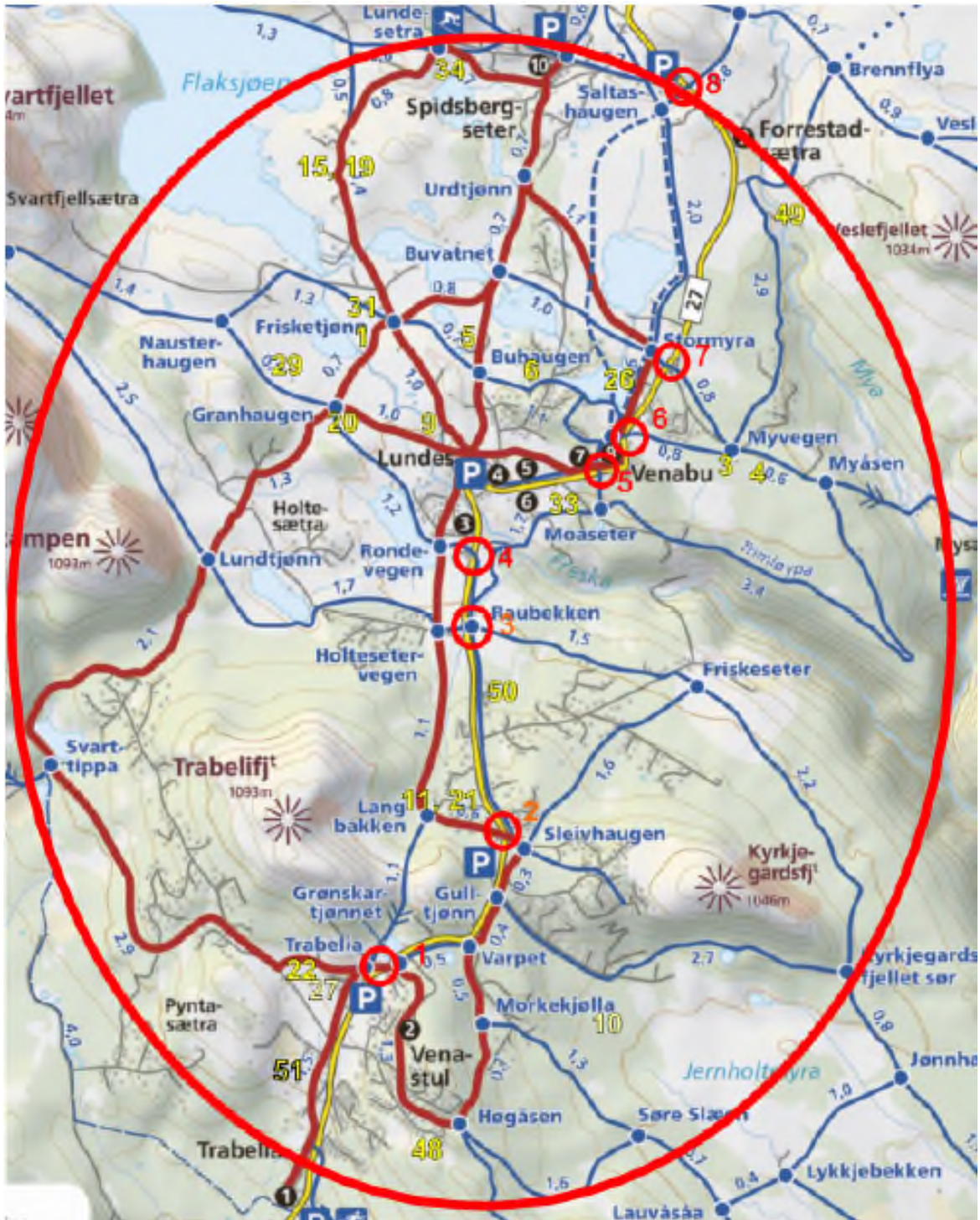
Figur 4: Kart som viser løypekryssinger med fv. 27 (røde ringer), og mottatte merknader (gule tall som henviser til nr. på merknad).