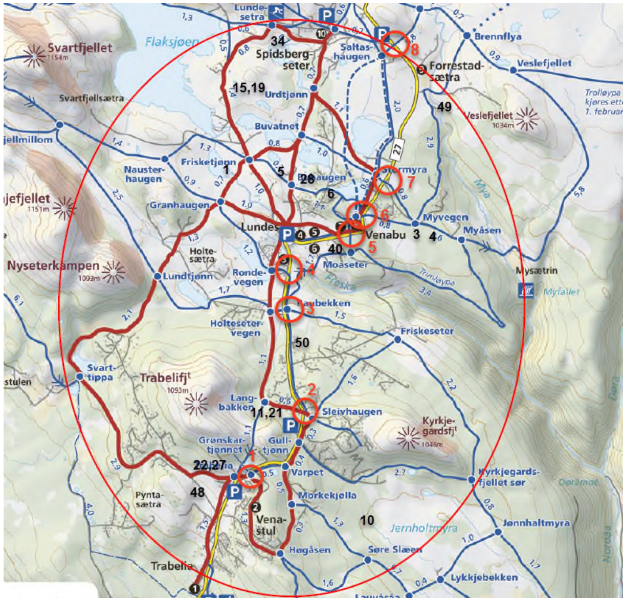
Figur 3: Planområdet med fv. 27 og kryssinger skiløype/fylkesveg, og parkeringsplasser

Kartet over viser fylkesveg 27 som går gjennom området, og det viser de 8 kryssingene mellom skiløype og fylkesveg (røde ringer). De største parkeringsplassene er også vist på kartet.